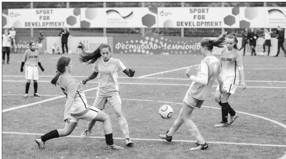
Тактична схема згодом переміститься з футбольного поля у суспільне

А поки що володаркою кубка EmPowerGirls стала дівчача збірна Києва. Титул віце-чемпіонки змагань здобули представниці Рівненського міжрегіонального центру розвитку дівочого футболу, юні гравчині Харківського МРЦ — бронзові призерки змагань.