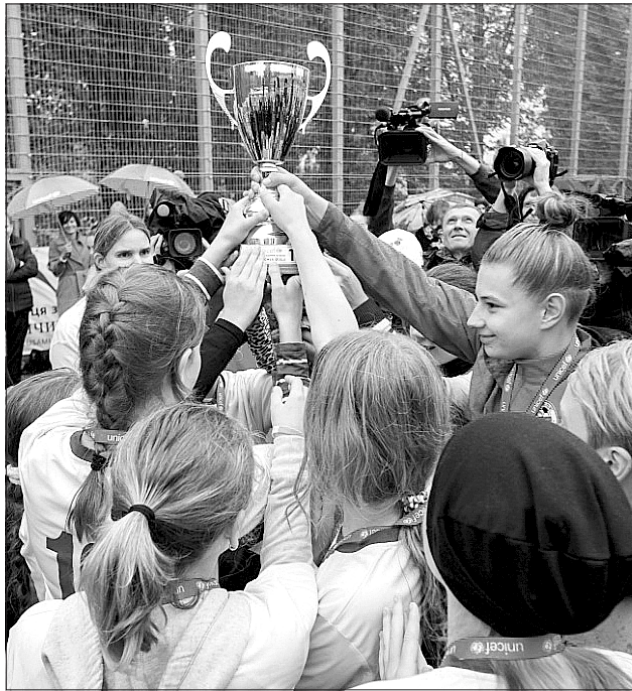
Ось він — омріяний кубок!

«В умовах збройного конфлікту в Східній Україні, який змусив понад 1,5 мільйона людей залишити домівки, особливо важливо підтримувати дівчат, допомагати їм здобути найнеобхідніші життєві навички і впевненість у собі. ЮНІСЕФ виступає за рівні права для кожної дитини. Тому нам важливо, щоб і дівчата, й хлопці мали однакові права та можливості в суспільстві й могли самостійно обирати улюблені заняття та реалізовувати свої мрії. Футбольний Кубок EmPower Girls — це позитивний приклад того, що люди незалежно від статі мають однакові можливості для реалізації у спорті. А також чудова нагода для дівчат з усієї України продемонстру-