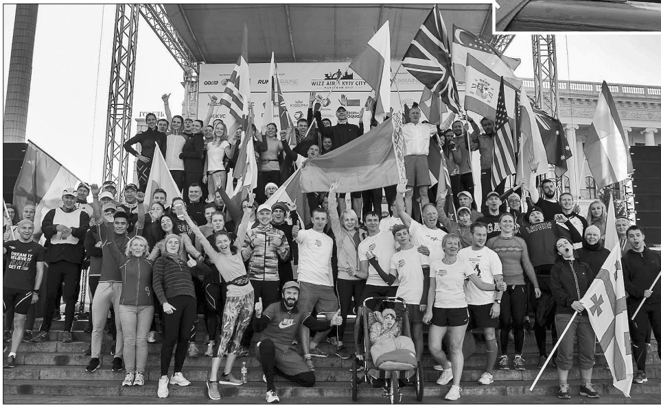
Київ вносять до свого розкладу дедалі більше бігунів

Окрім марафону, в неділю у Києві пройшли змагання і на інших дистанціях: напівмарафон — 21,0975 км, 10 км, 5 км, естафета, благо-