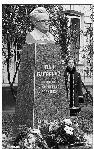
Відтепер Іван Багряний назавжди у рідній Охтирці

Олександр ВЕРТИЛЬ, «Урядовий кур'єр» ПАМ'ЯТНИК. У місті Охтирка на Сумщині відкрили пам'ятник видатному письменникові і громадсько-політичному діячеві Іванові Багрянюму (1906—1963) — авторові блискучих прозових і поетичних творів, відомих в усьому світі. З-поміж них романи «Сад Гетсиманський» і «Тигролови», написані значно раніше, ніж «Архіпелаг ГУЛАГ» Олександра Солженіцина і присвячені темі сталінських таборів. В урочистостях узяли участь представники місцевої влади, громадськості, духо-