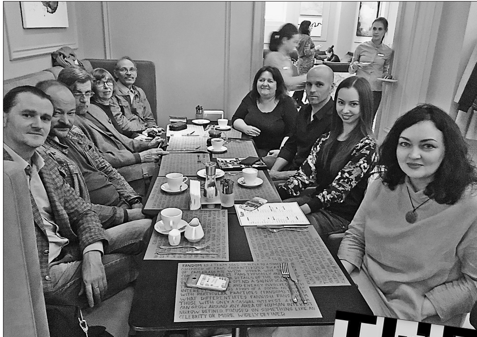
Творці першого номера вже обговорюють наступні випуски