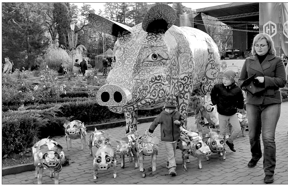
...а допитливі чомусики досліджують, чи металеве сало в металевих підсвинкв

На одній з фестивалю локацій подбали про своєрідний свинарник. Ні, тут показували не живих тварин, а металевих. Ці скульптури з металообробку виготовив відомий тернопільський митець Сергій Кузнецов. Найбільшу зацікавленість вони викликали в юних містян і в тих, хто бажав залишити для себе фотоспоминок про фестиваль.