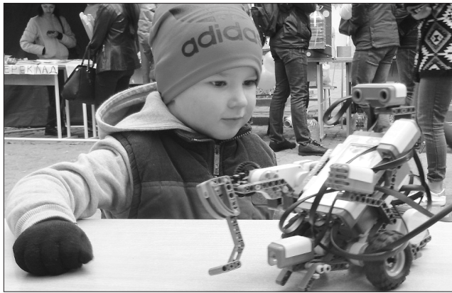
Такого робота в магазині не купиш