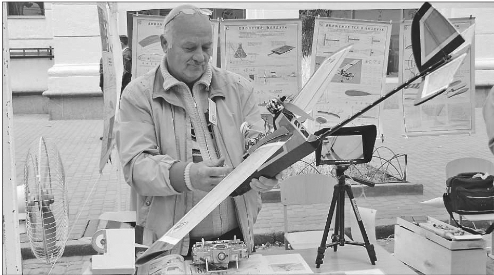
Ще одна цікавинка наукового пікніку в Полтаві — копія безпілотної

Наукові пікніки вже давно вподобали у Львові, Харкові, Києві й Тернополі. До речі, в цьому місті їх і започаткували. У переліку міст, де такі заходи прово-