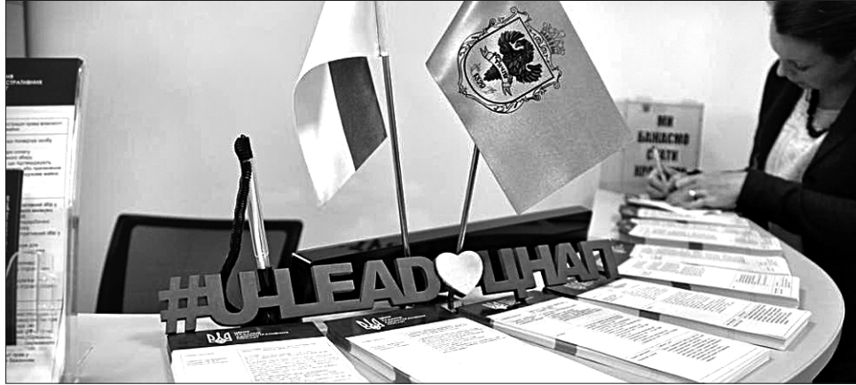
... а центр надання адміністративних послуг — перших відвідувачів

Головним подарунком будівельникам до свята став новий спорткомплекс. Його споруджували шість років (із дворічною перервою через брак коштів), але таки завершили.