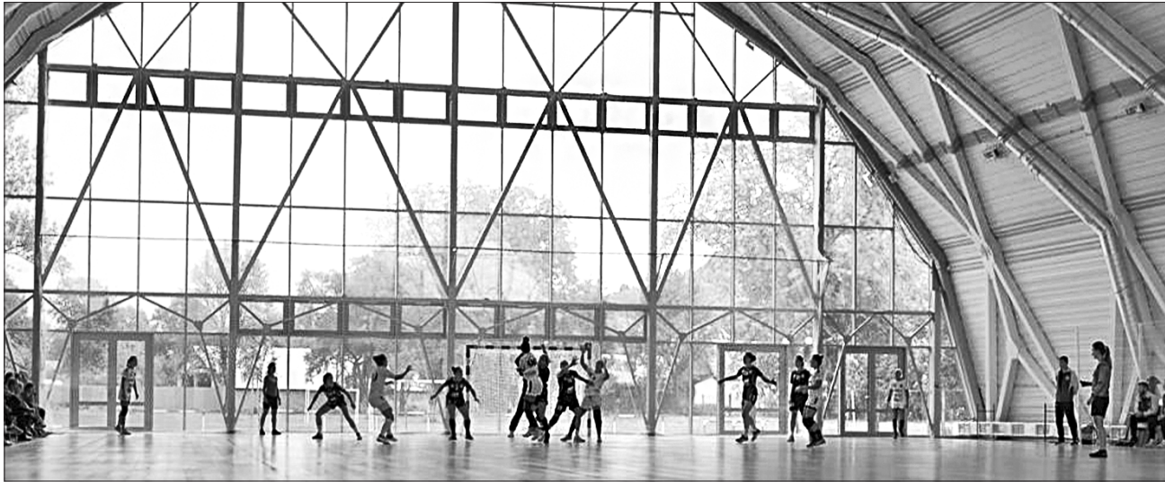
Спортивна арена «Тячів» прийняла перших гостей...

НОВОСІЛЛЯ. Радість відкриття буде підкріплено щоденною користю для Тячева