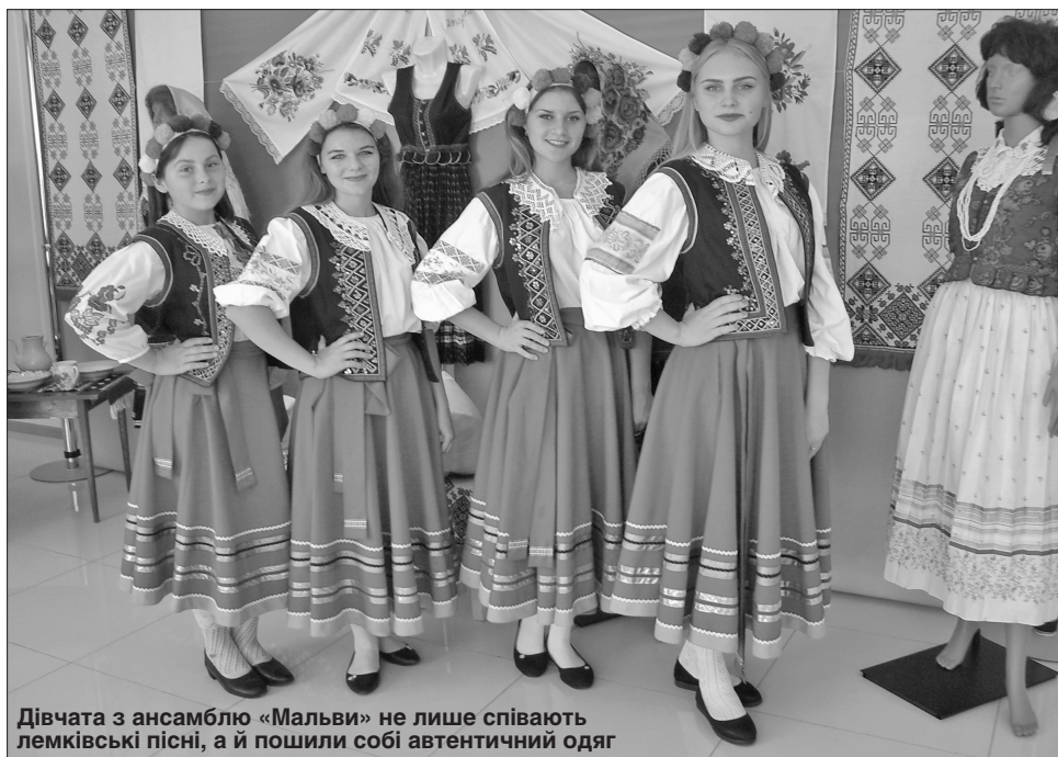
Дівчата з ансамблю «Мальви» не лише співають лемківські пісні, а й пошили собі автентичний одяг

«Мені випала нагода відвідати землі рідної для мене