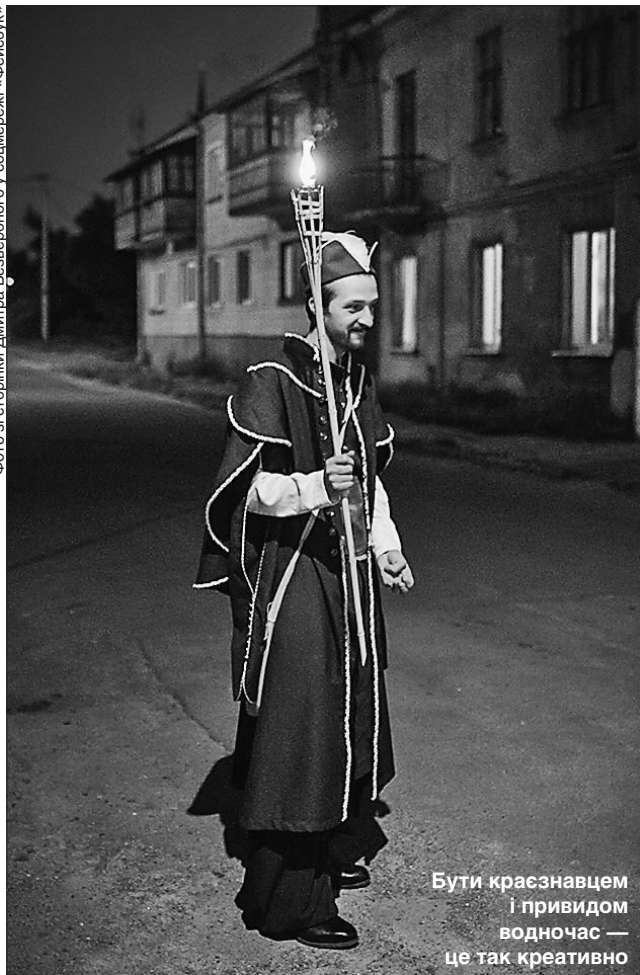
Бути краєзнавцем і привидом водночас — це так креативно