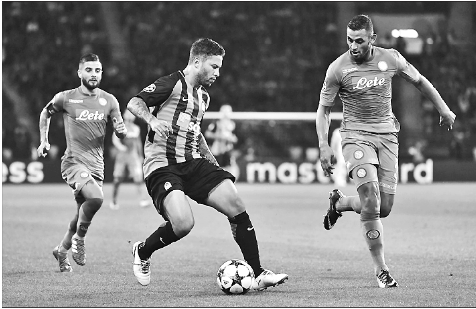
«Шахтар» добре вивчив козирі неаполітанців

Завершальна десятихвилинка пройшла в обопільних атаках, і рахунок між