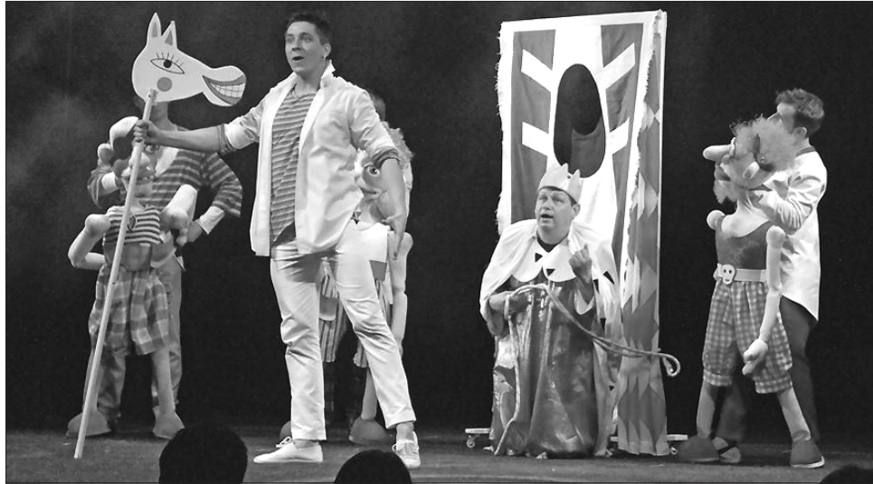
Ці «Бременські музиканти» не бояться ані злодіїв, ані Його величності короля

Організатори фестивалю — Київська міська державна адміністрація, Київський академічний театр ляльок, Всеукраїнська громадська організація «Український центр міжнародної спільки діячів театру ляльок «УНІМА-УКРАЇНА», Національна спілка театральних діячів України — очікують на історії від ляльок із понад 15 країн. До нас завітують Аргентина, Вірменія, Болгарія, Білорусь, Грузія, Іран, Ірландія, Канада, Колумбія, Німеччина, Португалія, Туреччина, Франція, Хорватія, Чилі,