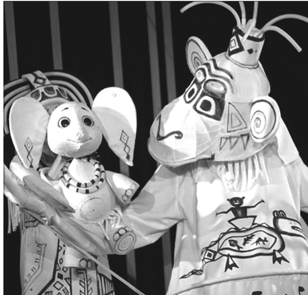
КМАТЛ на лівому березі Дніпра дасть відповідь на запитання: «Чому довгий ніс у слона»

Журі оцінюватиме режисуру, сценографію, музичне оформлення й авторську роботу учасників фесту. А ідея проекту невібаглива: привернути увагу киян до мистецтва лялькового мистецтва, ознайомити їх у такий спосіб із культурою Києва, а ще — налагодити творчі зв'язки з лялькарями-артистами з різних країн. Тенденції змінюються швидко навіть у ляльковому мистецтві. Саме тому на культурних сценічних майданчиках представляють усі види ляльок. Завдяки цьому глядачі побачать різноманітні способи показу вистав.