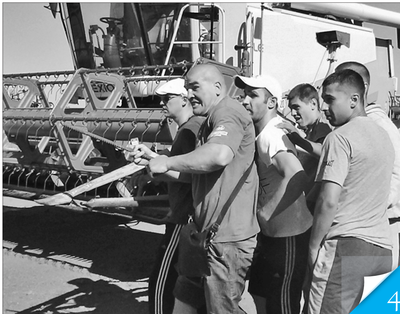
Силіві захоплення сільгосппідприємств перетворилися на лихо національного масштабу

ГОСТРА ТЕМА. Влада й бізнес визнають нагальність цього завдання, але підходи до його розв'язання трохи відрізняються