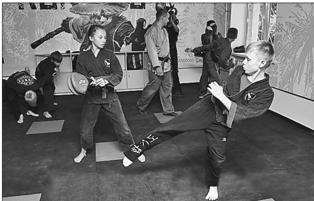
Уже перші заняття в спорткомплексі зібрали сотні дітлахів та підлітків

СПОРТ ДЛЯ ВСІХ. До півтисячі дітлахів, які захоплюються воркаутом (від англійського workout — масовий спортивний рух, який об'єднує тих, хто тренується на вуличних спортивних майданчиках) та східними единоборствами, прихистить під своїм дахом найбільший у країні спортивний комплекс «Торсіон». Його було нещодавно відкрито в Індустріальному районі Харкова. Тут на 400 квадратних метрах розташовані зали з тренажерами і спеціальним обладнанням для тренувань на турніках, гімнастики та інших фізичних вправ. Це вже другий у Харкові спортивний центр такого профілю,