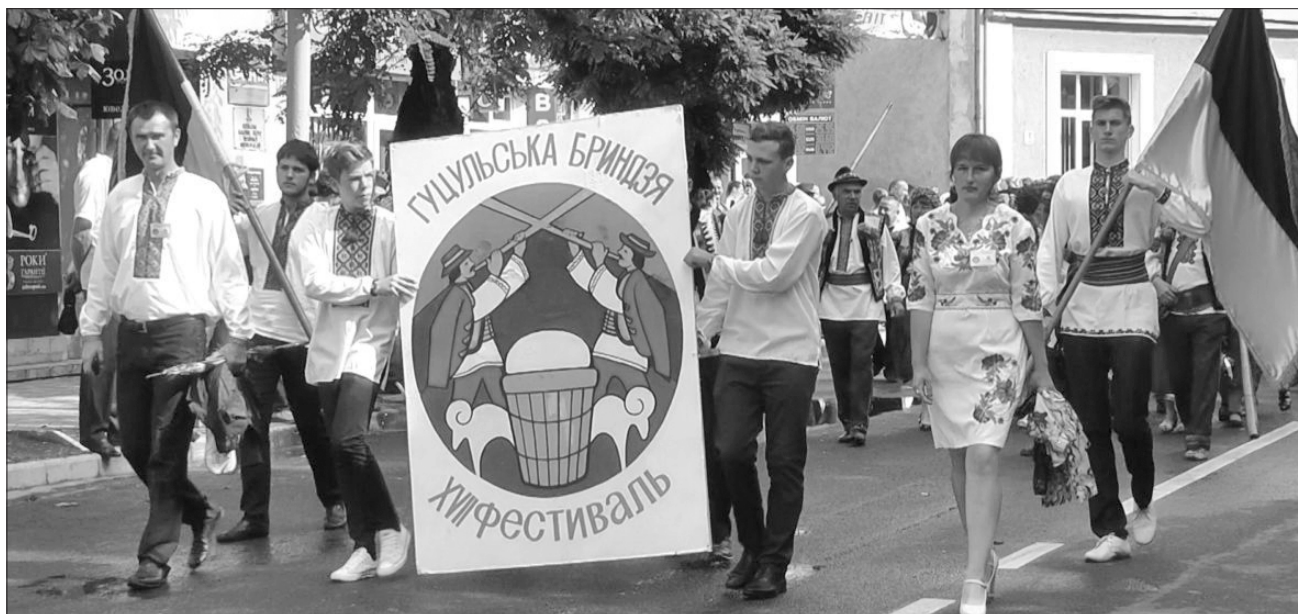
Урочиста хода центром Рахова