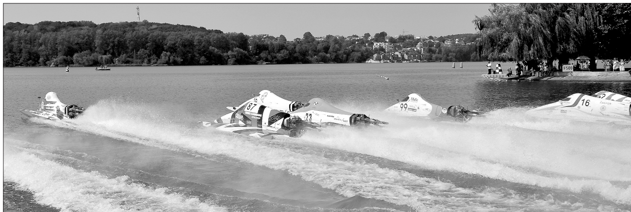
Помчали здобувати місця

На набережній Тернопільського ставу п'ять років тому вчисті заклали Алею чемпіонів, відтоді тут щороку з'являються імена нових звитяжців міжнародних водно-моторних змагань. Нинішнього серпня пам'ятний знак відкрили чемпіону Європи Массімо Россі. До слова, цей титул у класі човнів F-250 він здобув торік саме в Тернополі. На превеликий жаль, згодом під час перегонів у Німеччині гонщик загинув.