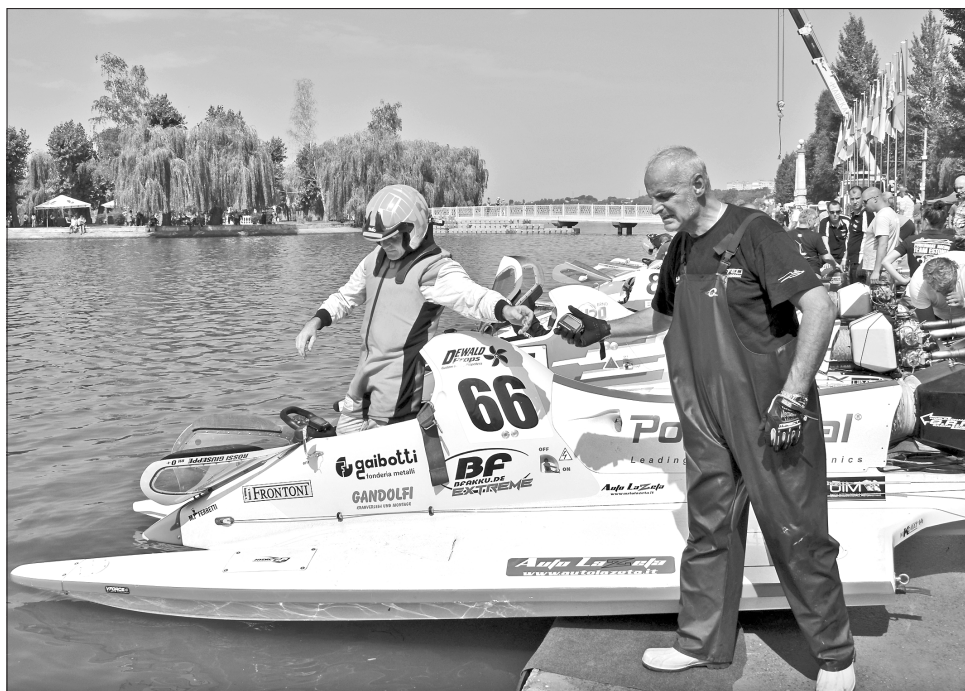
До перегонів готується італійська команда

Поки спортсмени готувалися до заїздів, автор цих рядків поцікавився у Віктора Шем-