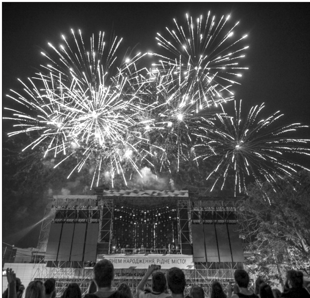
Вечірнє небо прикрасив святковий феєрверк

223-й день народження Одеса почала святкувати ще в останні дні серпня. Один лише перелік святкових подій налічував ледь не півсотні пунктів. Тут і виставка сучасного мистецтва, і відкриття нової експозиції музею-квартири Леоніда Утьосова, і мальовничі акції до днів Японії в Одесі. А ще історичні краєвиди у проекті «Одеса в старих фотографіях» та відносно нові знімки на фотовиставці, присвяченій 45-й річниці побратимських зв'язків між Одесою та французьким Марселем. А фестиваль світлових, архітектурних, проєкційних технологій та інсталяцій Odessa light fest тривав перші три вересневі дні.