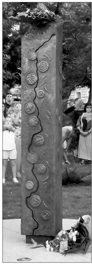
Першими в Одесі були греки

Що ж того вечора ще зміг застати Сергій? Лише останні номери гала-концерту, котрий, щоправда, і є кульмінацією свята. І ще встиг хіба побачити традиційний святковий феєрверк. Але залишитись того дня зовсім без свята Сергій просто не міг, бо для справжнього одесита 2 вересня — це святе.