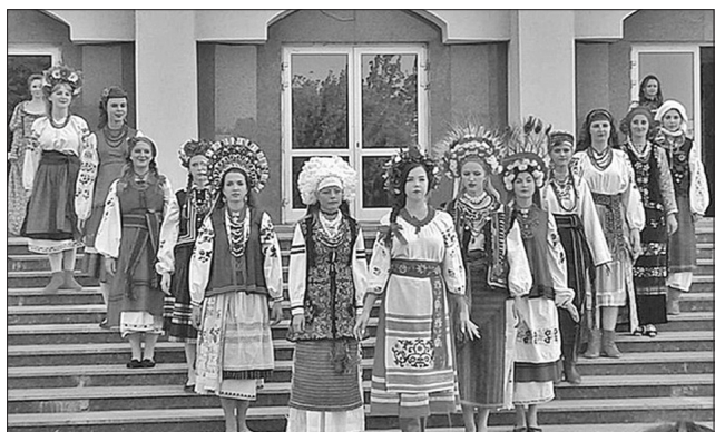
Родзинкою модного дефіле під час фестивалю став показ традиційного весільного вбрання з різних регіонів України

Канів на три дні, протягом яких тривав фестиваль, перетворився на кіностолицю, де на двох локаціях можна було переглянути різноманітні за жанром стрічки. Окрім їхнього перегляду, чим буквально жила навколومистецька спільнота та гості міста, фестиваль запам'ятався виступами оригінальних українських гуртів, модними дефіле та майстер-класами зі сценарної та операторської роботи. Гостей фестивалю також запрошували на перегляд виставок відомої канівської мисткині Любові Миненко, VII-го Міжнародного скульптурного симпозиуму та екскурсію «Довженківський обрій», під час якої гості мали змогу оглянути місця, де знімали відомі Довженкові фільми «По-