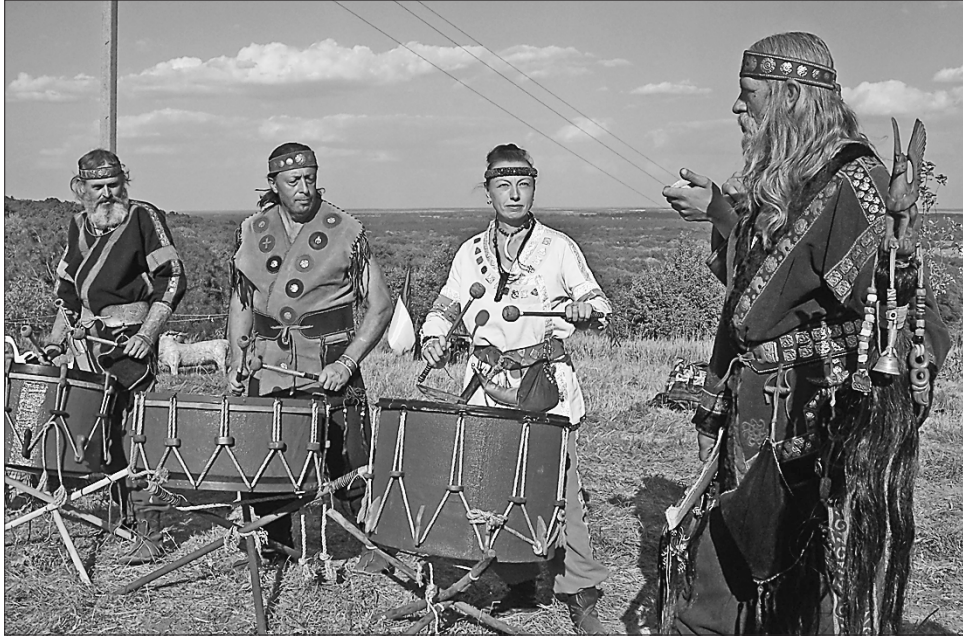
Вбрання та культуру скіфів максимально можливо передали реставратори із Запоріжжя

«У цьому сезоні ми розкопали золоті бляшки, бронзове дзеркало із зображенням пантери, шкіряний пояс із бронзовими виробами на ньому, елементи зброї, сагайдачний набір, прикрашений золотими пластинами, цілу грецьку амфору, глиняний глечик, останки кістяків людей і коня. Усім