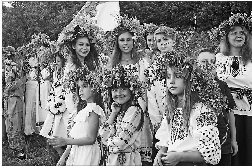
Ці юні котельвці народилися в незалежній Україні