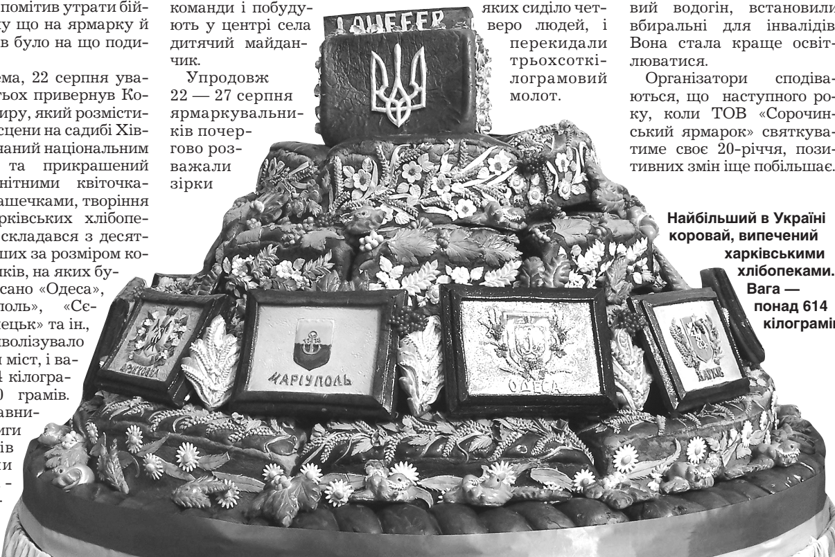
Найбільший в Україні коровай, випечений харківськими хлібопекими. Вага — понад 614 кілограмів

Такий стимул запроваджено відповідно до програми «Фізична культура і спорт міста Суми на 2016—2018 роки», що передбачає всіляку підтримку, розвиток і популяризацію здорового способу життя, матеріальне стимулювання тренувань і професійного заняття спортом.