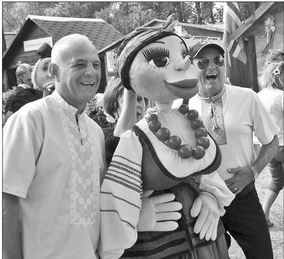
Усі чоловіки хотіли сфотографуватися із Солохою

НАЦІОНАЛЬНИЙ БРЕНД. Персонажі гоголівських творів уперше в історії каталися на конях