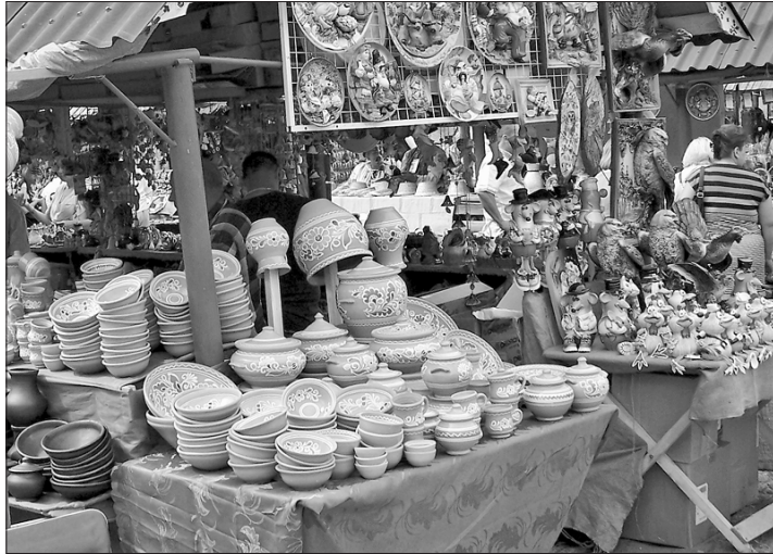
Чого тільки немає на тому ярмарку!

Олександр ДАНИЛЕЦЬ, «Урядовий кур'єр»