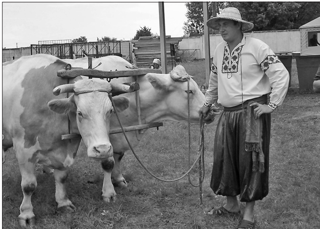
Колись воли були головним транспортним засобом, а нині Гайок і Соловей — атрибути Сорочинського ярмарку

Перенесли на інше місце і фактично заново побудували головну сцену. Реорганізували ярмаркову територію, всі кафе і ресторани розташували в окремому секторі, отож всі торгові точки нині в рівних умовах. Організатори запевнили, що зростуть і вимоги до закладів громадського харчування, до їхнього зовнішнього вигляду, санітарного стану, обладнання, меню української кухні.