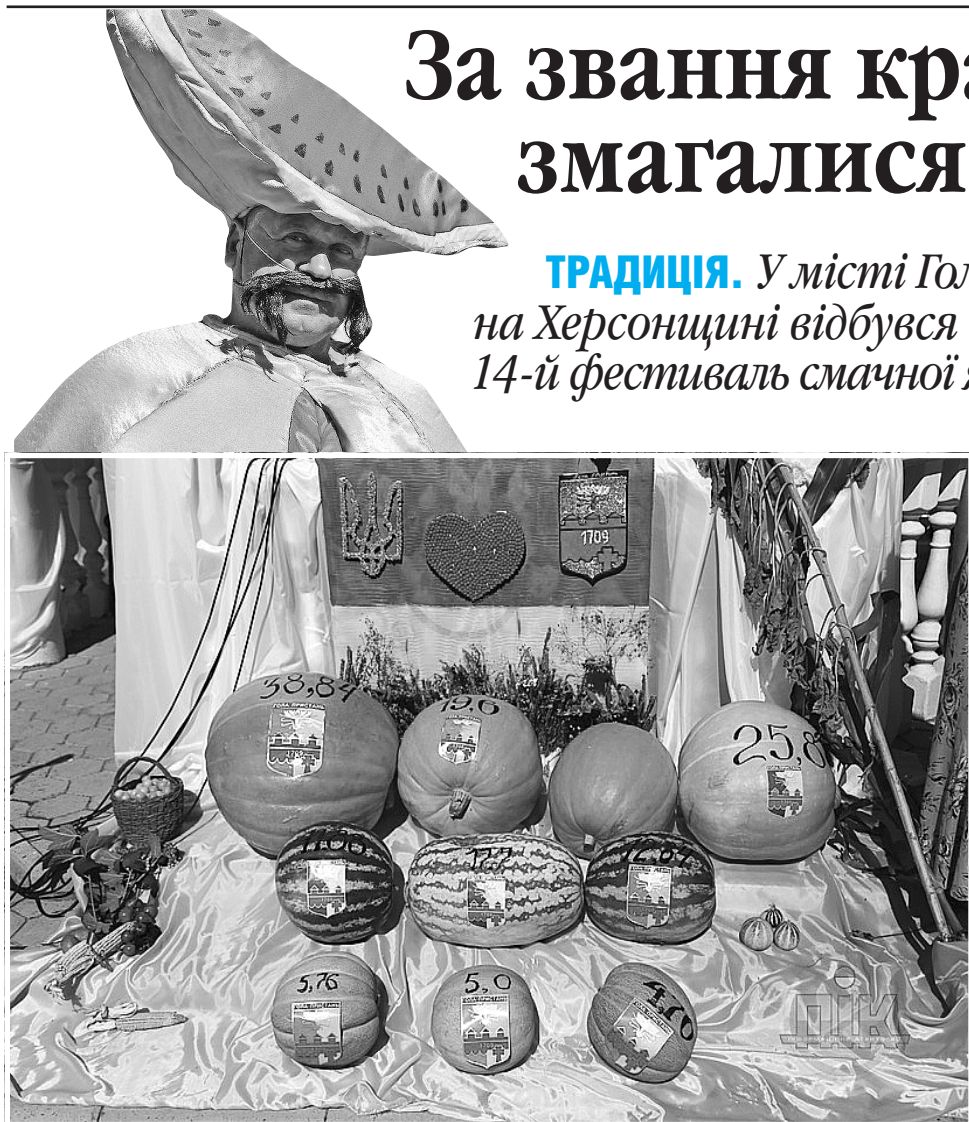
І великі, і малі однаково смачні

ТРАДИЦІЯ. У місті Гола Пристань на Херсонщині відбувся вже 14-й фестиваль смачної ягоди