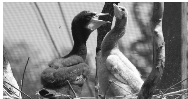
Новонароджені звірята отримали імена: мавпочка — Ізі, конячка Пржевальського — Пегас, скусні — Чіп і Дейл, баклани — Чук і Гек

У зеленої мавпочки дитинча народилося в середині червня, весь час перебуває біля мами й обережно знайомиться з навколишнім світом. У вольєрі звичайних європейських та білих ланей можна спостерігати за молодим поповненням. Малуки вже впевнено тримаються на ніжках, граються та опановують новий простір під наглядом матері. Народили діточок і скусні. Двійко маленьких хижаків