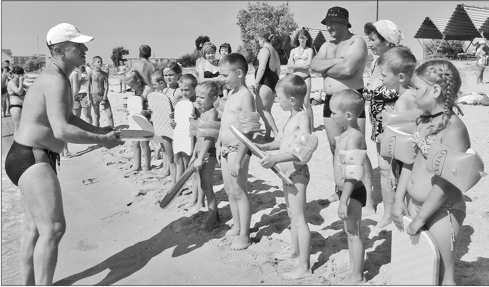
На морі всі діти бажають навчитися плавати, і добре, коли дорослі створюють для цього умови