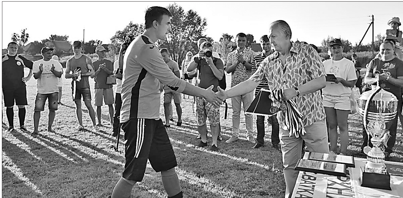
Нагороди переможцям вручає колишній гравець київського «Динамо» і тренер збірної України з футболу Михайло Фоменко

ФУТБОЛ. Уперше відбулися змагання на честь відомого сумчанина — колишнього тренера збірної України