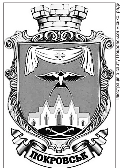
Ілюстрація з сайту Покровської міської ради

Як відомо, торік у березні під час пошуків нової назви в міській раді також обговорювали два ймовірні варіанти. Назву Гришине (так називалося місто до 1934 року, а нині неподалік нього є село з такою самою назвою) спершу погодив парламентський комітет із державного будівництва, регіональної політики та місцевого самоврядування, однак депутати міської ради наполягли на нинішній назві міста Покровська.