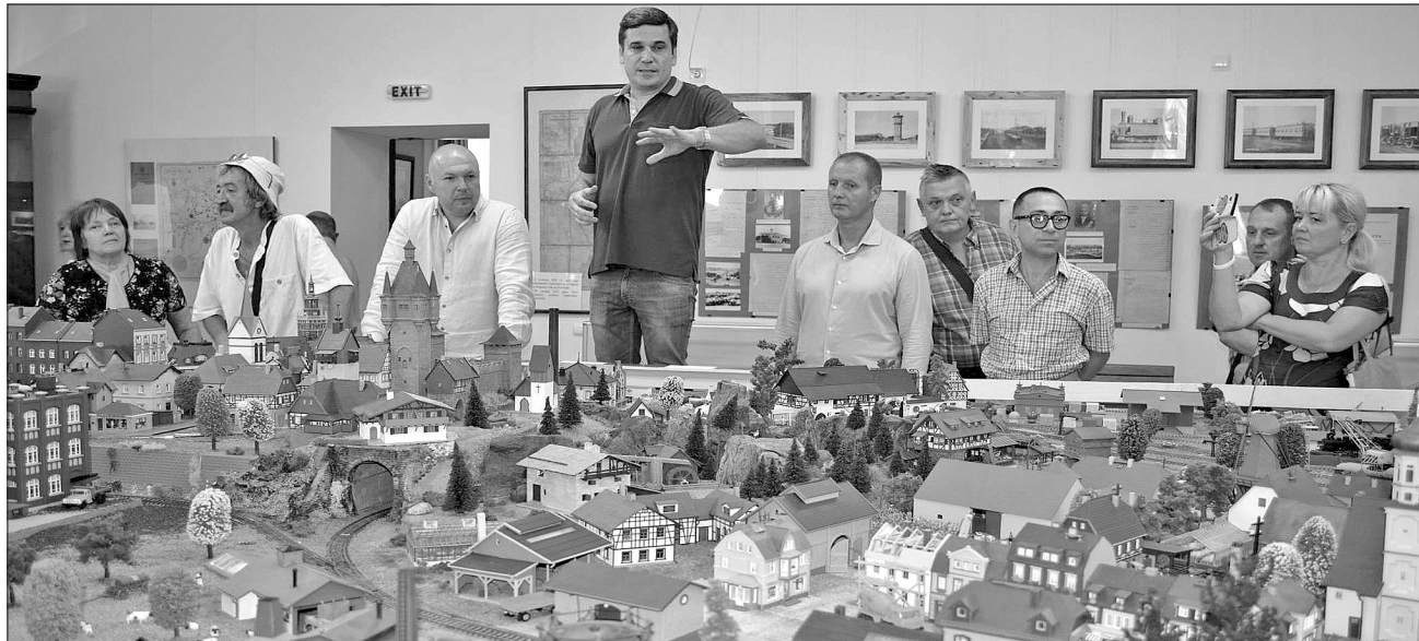
Автори проекту презентують своє дітище численним відвідувачам музею