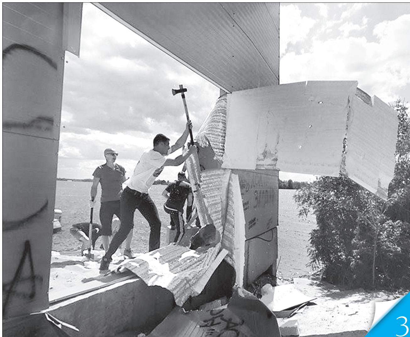
Село Козин Київської області: люди відновлюють своє право на доступ до узбережжя

ВІДНОВИТИ СПРАВЕДЛИВІСТЬ. Громадяни вимагають ухвалити закон про безперешкодний доступ до річок, озер, морів