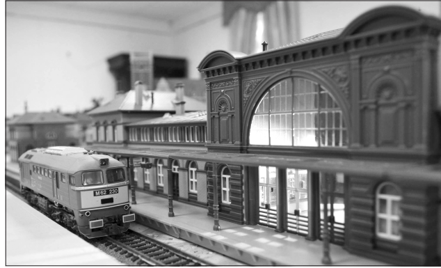
Мініатюрний потяг прибуває на залізничний вокзал

Крім макета міста, на виставці представлені унікальні артефакти, які розповідають про будівництво та історію Миколаївської залізниці. Це ліхтарі сигналь-