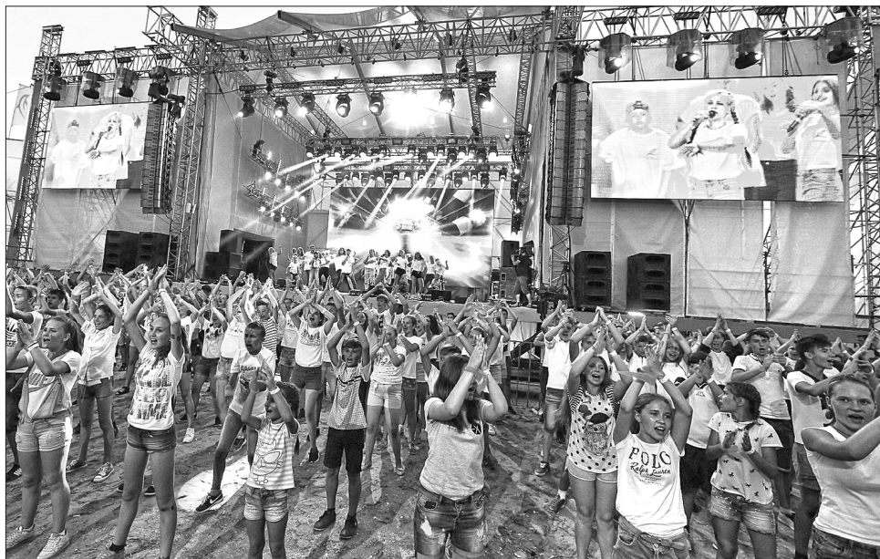
Фінал «Чорноморських ігор» перетворився на яскраве свято