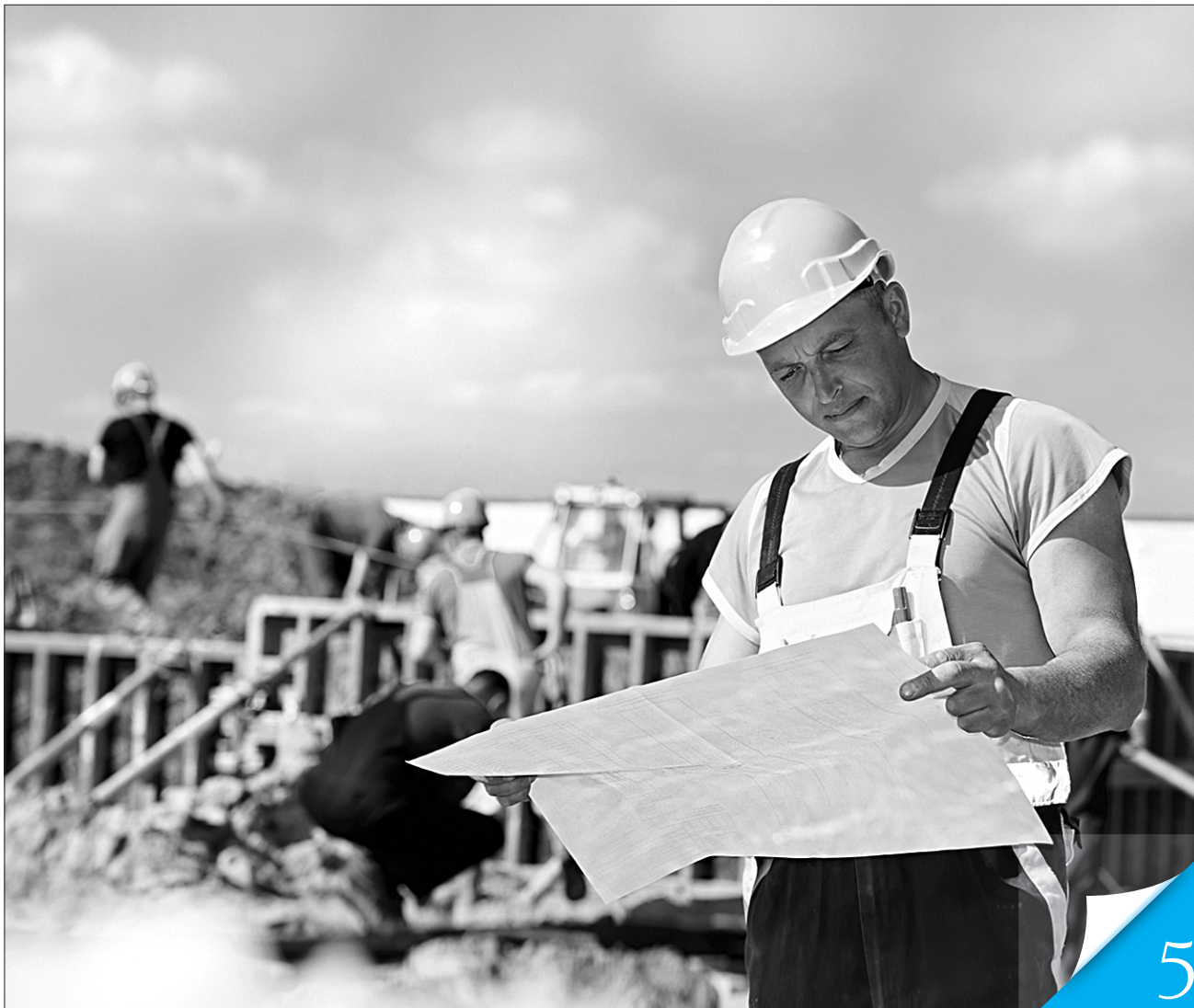
Фаховість і досвід українських будівельників високо цінують і за кордоном

РОБОТА. Зарплати зростають, конкуренція зменшується, та рівень трудової міграції все ще дуже високий