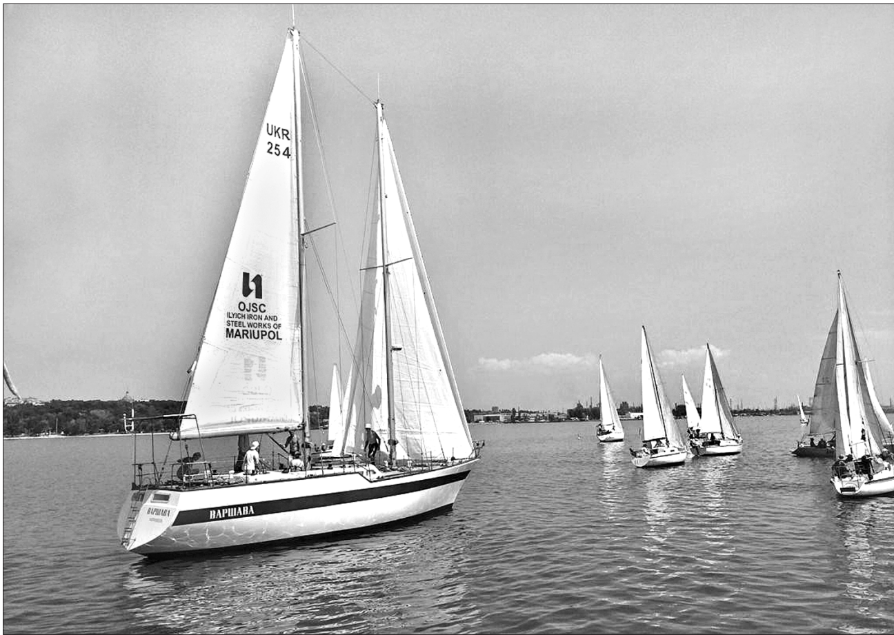
Щосуботи в серпні в акваторії біля Маріуполя відбуватимуться перегони, підсумки яких підб'ють у День Незалежності