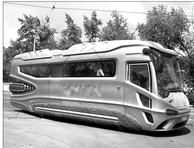
Автобус упевнено почувається на вулицях міст

В автомобілебудуванні космічним дизайном активно захоплювалися в США ще в 1950-ті роки. Хто б міг подумати, що про нього згадають і застосують на новому туристичному автобусі українського виробництва. До речі, цілком виправдано, адже нова машина призначена для дитячих екскурсій.