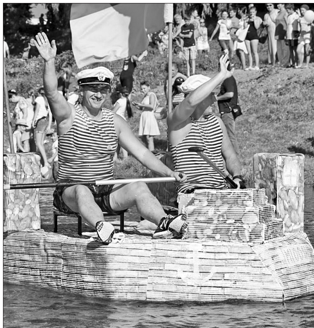
Міський голова Богдан Андріїв на дистанції

«Човни» на Ужї викликали сміх і захоплення численних ужгородців, які вийшли на береги Ужа, і туристів. Якщо плавзасіб потрапляв на міліну, а та-