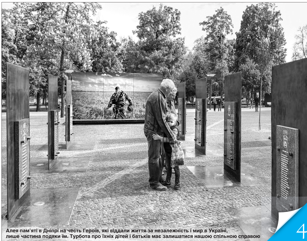
Алея пам'яті в Дніпрі на честь Героїв, які віддали життя за незалежність і мир в Україні, лише частина подяки їм. Турбота про їхніх дітей і батьків має залишатися нашою спільною справою

КОРИСНИЙ ДОСВІД. «Урядовий кур'єр» розповідає про успішну роботу системи допомоги учасникам АТО і членам їхніх сімей