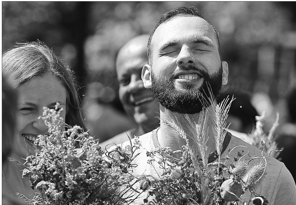
Натхнення і здоров'я, мудрості і доброти прагнемо у серпневі свята

На Мокрини за погодою слід спостерігати весь день. Якщо вранці йтиме дощ, початок осені буде вологим, а