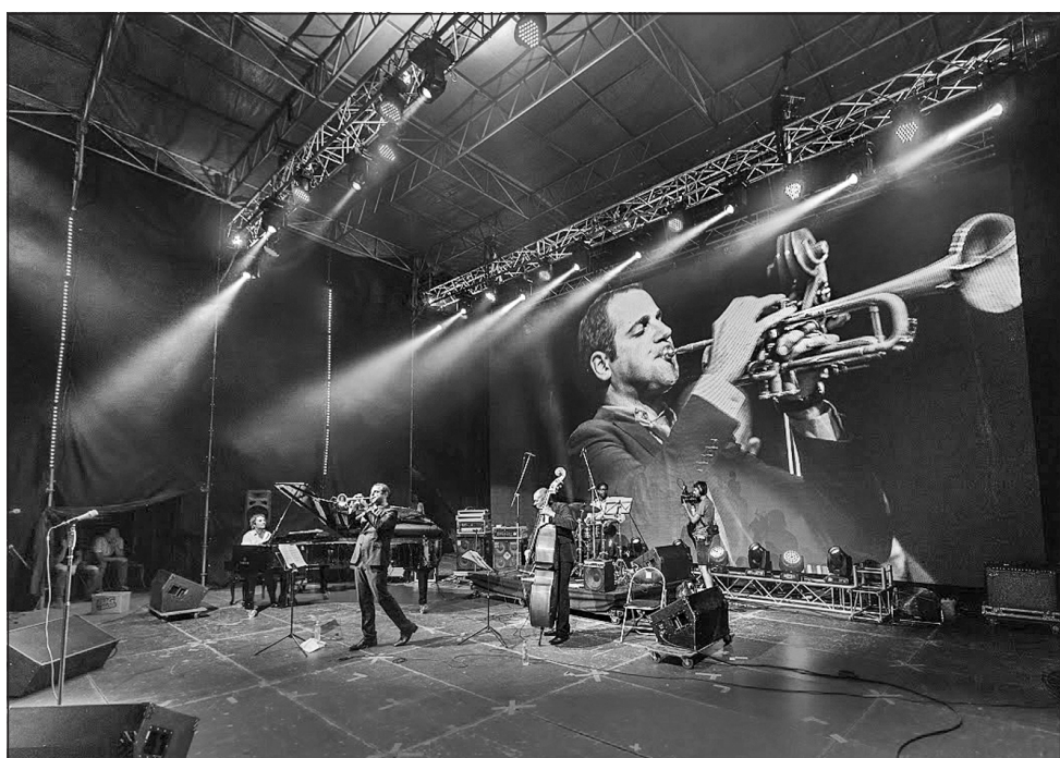
Музиканти з різних країн радували глядачів своєю виконавською майстерністю

Наступного року фестиваль «Джаз на Дніпрі» відзначатиме півстоліття. Будемо сподіватися, що він стане щорічним.