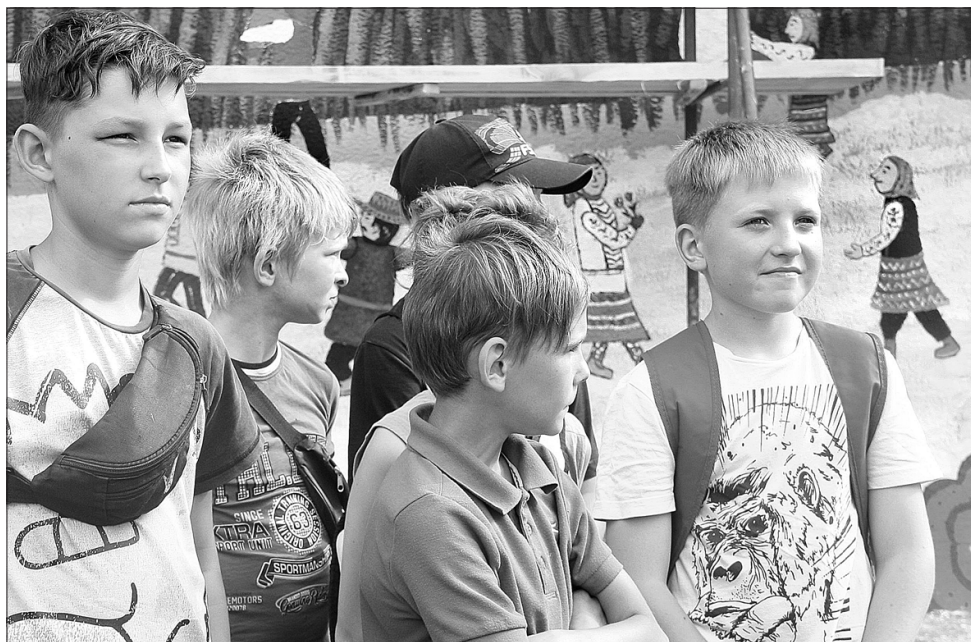
Маріупольські прототиби новоселів «Рукавички»