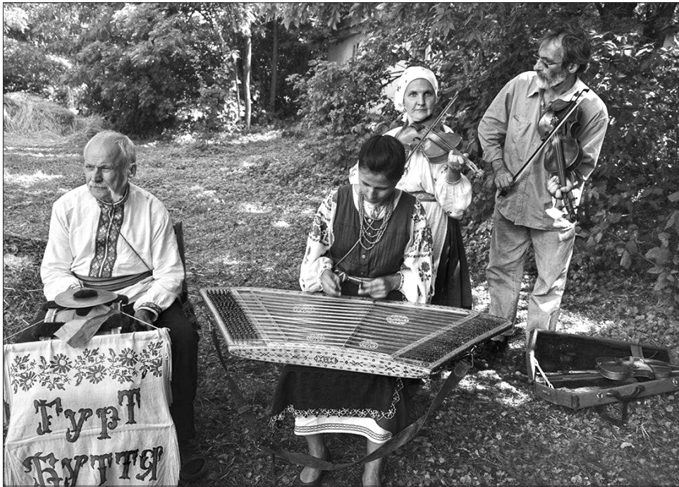
Київський гурт «Буття» продовжує традиції українського автентичного співу