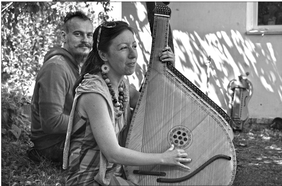
Виконавці народних пісень завжди з радістю діляться своїм мистецтвом

ВІРТУАЛЬНІ МАНДРИ. Компанія Google разом з Міністерством культури України оцифрували сім музеїв просто неба в різних регіонах країни і створили віртуальний тур ними. Відтепер 3D-туром можна помандрувати і в резиденцію Богдана Хмельницького в Чигирині. На спеціальному сайті «Музеї просто неба» можна здійснити віртуальну подорож, дізнатися про історію життя в різних регіонах, а також ознайомитися з народною архітектурою та побутом. 3D-тури музеями доступні в режимі Street View на Картах Google. Віртуальна екскурсія доступна трьома мовами — українською, російською та англійською. 360-градусні панорами дають змогу прогулятися територією музеїв, зазирнути в будинки й ознайомитися з експозиціями. Проект — частина кампанії «Автентична Україна». До нього увійшли музеї народної архітектури та побуту в Києві (Пирогів), Львові («Шевченківський гай»), Переяслав-Хмельницькому та Ужгороді, Центр народознавства «Мамаєва Слобода» (Київ), Запорозька Січ — заповідник «Хортиця» (Запоріжжя) та резиденція Богдана Хмельницького в Чигирині.