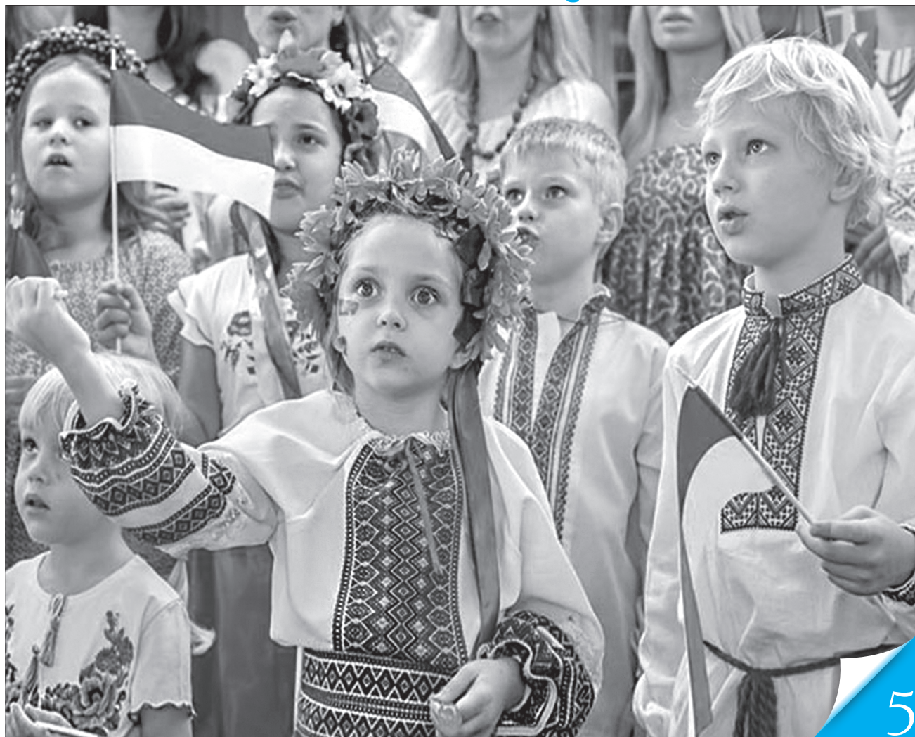
Ці діти і в далекому Сингапурі не забувають, що вони — українці

РАЗОМ. Молоді українці, які зробили успішну кар'єру за кордоном, докладають зусиль до лобювання інтересів рідної держави 5