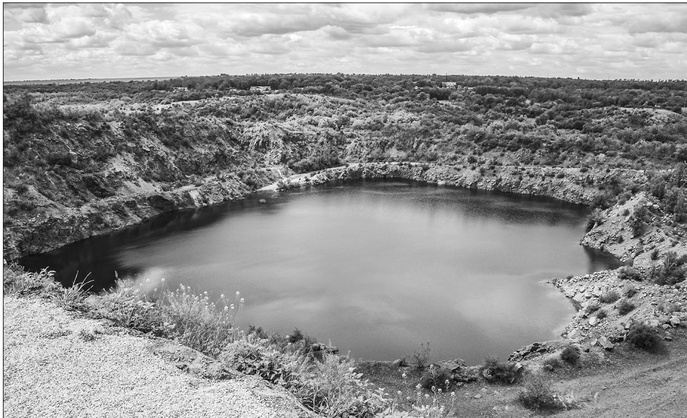
Тепер цю красу можна побачити з висоти польоту

А поки що туристи з усієї України зможуть милуватися озером з облаштованого оглядового майданчика, пройти місцевими екскурсійними стежками, ознайомитися з історією та природою цього краю, відпочити у наметах і взяти участь в екстремальних розвагах.