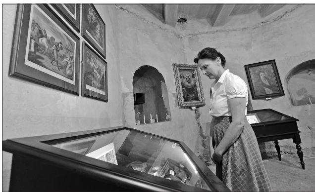
Стіни, які потребують ремонту, лише підкреслюють цінність експонатів

У понеділок Національний Києво-Печерський історико-культурний заповідник спільно з Фондом Миколи Томенка «Рідна країна» та Музеєм Шереметьєвих зібрали в приміщенні Мазепіної (Онуфріївської) вежі виставку одного дня «Гетьман Іван Мазепа — особистість, державник, меценат».