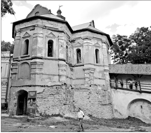
Перед початком реставраційних робіт з пристосування пам'ятки під Музей Івана Мазепи вона вперше набула значення експозиційного простору

У Національному Києво-Печерському історико-культурному заповіднику досі зберігся комплекс оборонних, господарчих і культурних пам'яток, пов'язаних з іменем Івана Мазепи і його близького оточення. Одна з найзагадковіших пам'яток цього комплексу — Онуфріївська, або Мазепа тріархна церква-вежа, яка відтворює в цеглі традиційні в Україні козацьких часів форми дерев'яного храму. Деякі дослідники вважають, що Іван Мазепа планував зробити її усипальницею для свого роду. Та церкву-вежу так і не було повністю добудовано, і понад три століття її використовували як господарську споруду.