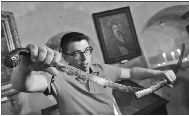
Гетьман добре знав: зброю в піхвах треба тримати гострою