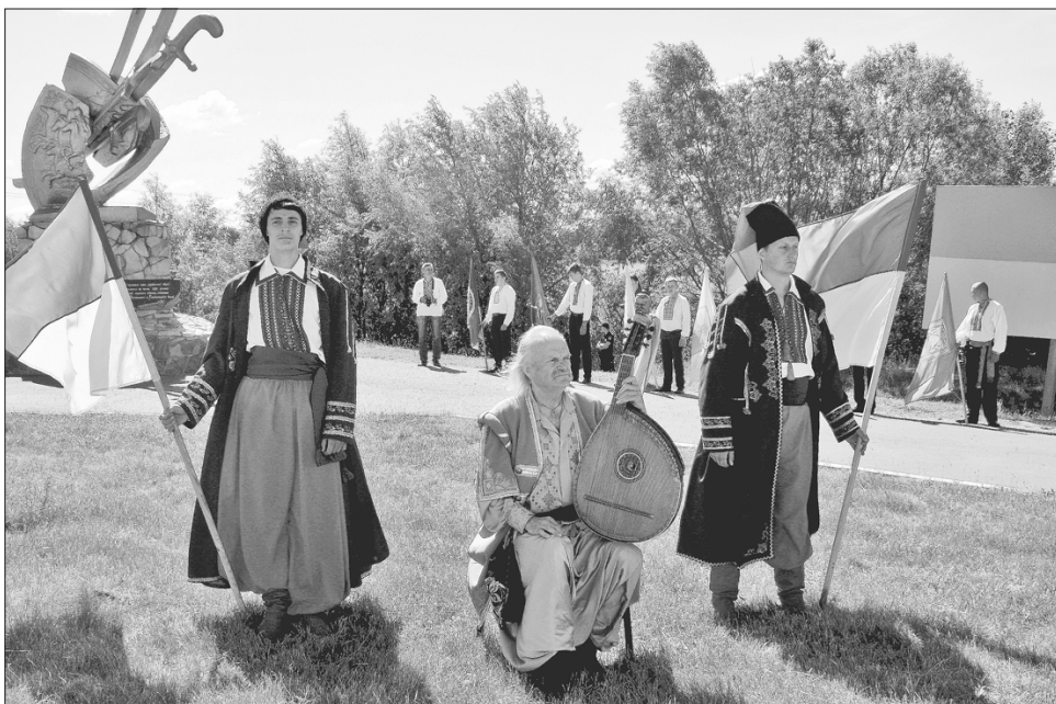
Козацькі мелодії вічні

Із пристрасним словом до учасників свята звернувся український поет, громадський діяч Герой України Дмитро Павличко. Він нагадав, що під Конотопом Україна виграла битву, проте зазнала поразки у війні. І фактично нині наша держава продовжує війну, яку не вдалося закінчити перемогою.