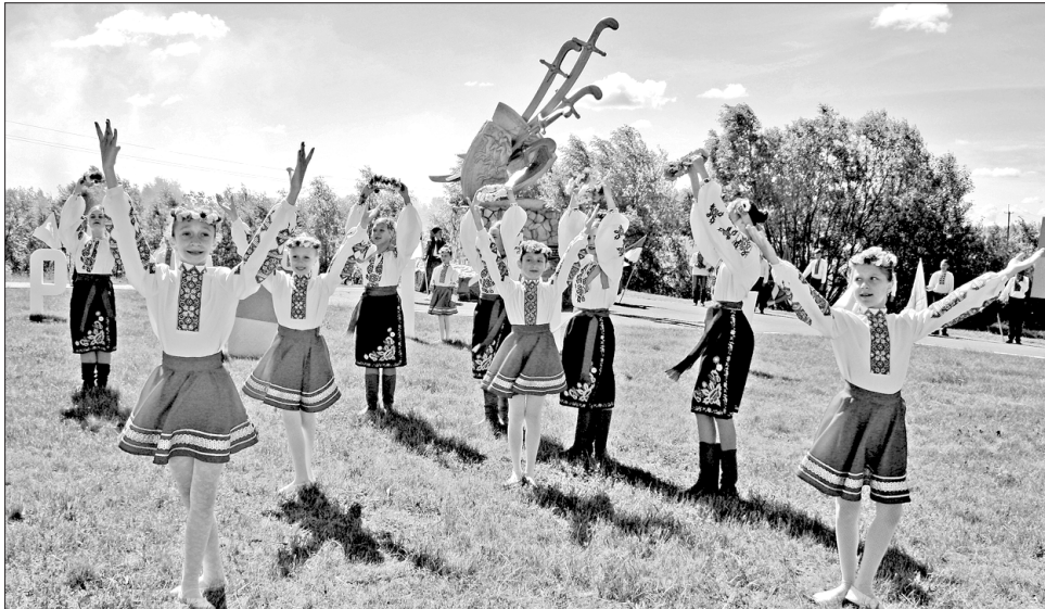
Вітання від козачат

Ті давні уроки й нині актуальні. Адже саме російські війська знову прийшли на українську землю, окупували Крим і підтримують сепаратистів Донбасу. Як наголосив Рефат Чубаров, маємо повторити те, що зробили наші пращівці 358 років тому, — разом очистити нашу землю від російських окупантів.