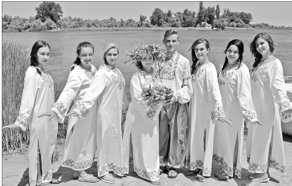
Колектив «Модерн» представив театралізоване купальське дійство

Звісно, не обійшлося на святі без конкурсу «Купальська красуня», який викликав у глядачів особливу зацікавленість. Юні чарівні талановиті красуні