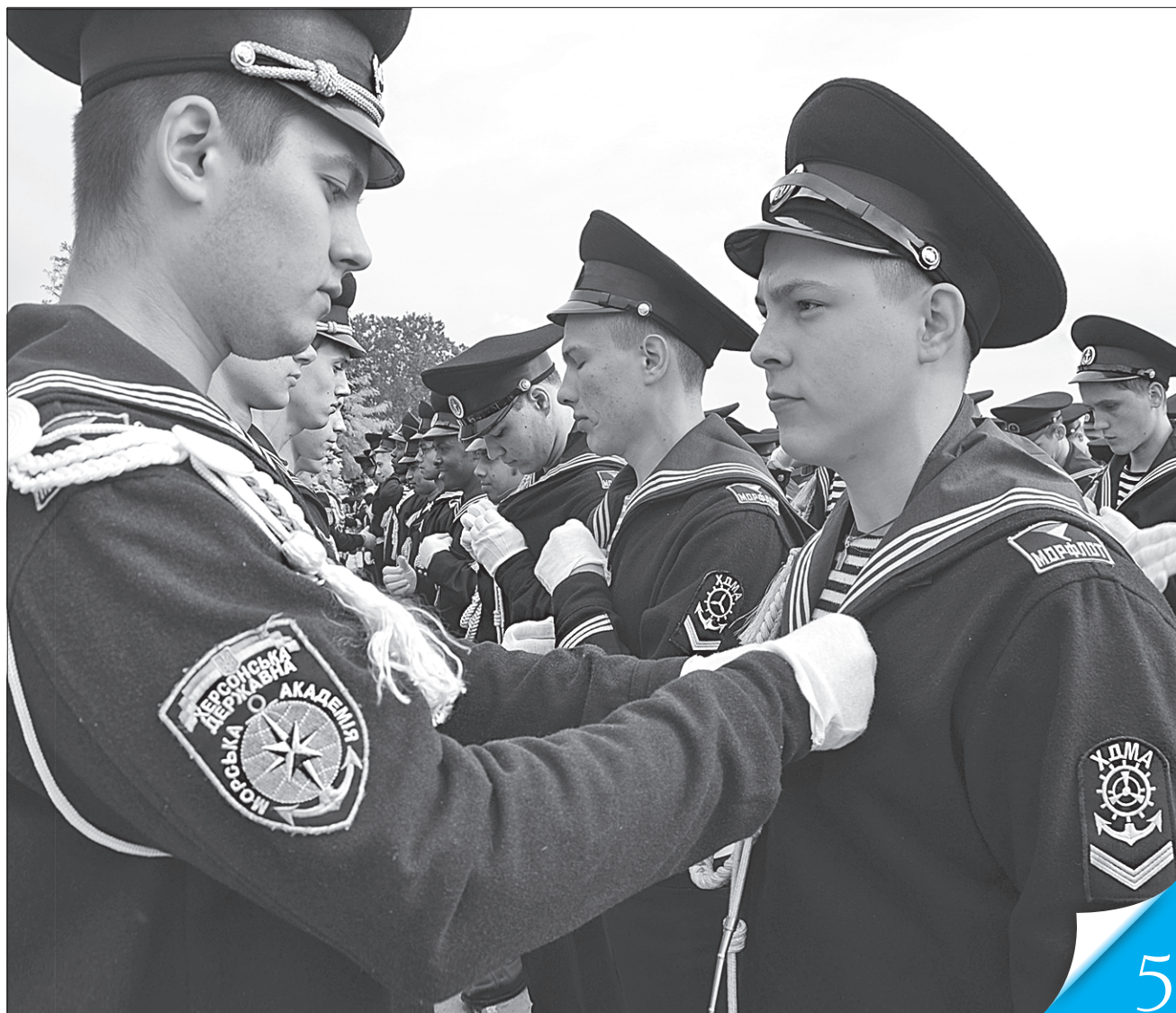
Торік найсильніші абітурієнти обрали серед інших Херсонську морську академію

ВИБІР. «УК» дізнавався, до яких університетів не варто вступати