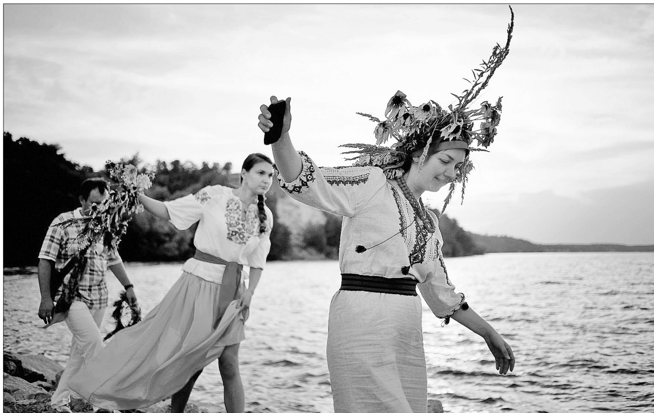
Дівочий вінок — один із найпотаємніших сакральних кодів української нації

НАРОДНІ ПРИКМЕТИ. Якщо на Івана Купайла ніч зоряна, осінь буде з грибами, а піч — з пирогами