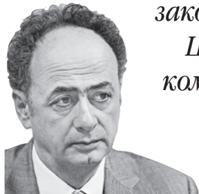
Голова Представництва ЄС в Україні про довіру громадян до обраних політиків і державного апарату

Г'Ю МІНГАРЕЛЛІ: «Потрібні новий закон про вибори і нова Центральна виборча комісія. З не зрозумілих мені причин ці реформи повністю зупинено».