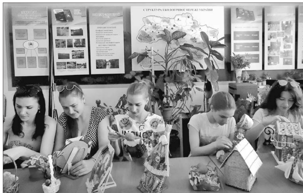
Така творчість не лише допомагає очищати довкілля, а й розвиває уяву

Для створення поробок, переконані студенти, зовсім не обов'язково спеціально купувати якісь дорогі матеріали, адже багато чарівних, стильних і оригінальних речей можна зробити власними руками зі звичайної вторсировини, тобто з того, що люди зазвичай викидають у відро для сміття. Такі вироби зі, здавалося б, непридатної матері-