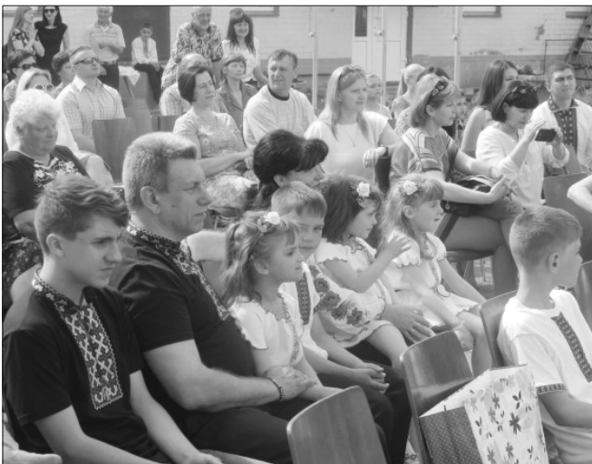
Радість новосілля наповнює й дорослих, і дітей

Представники влади побажали, щоб у нових домівках панували мир і злагода, вручили приємні й корисні в побуті подарунки. Це не перші родини, які святкують новосілля на Черкащині. Уже два роки сім'я з Катеринопільщини мешкає у такому самому двоповерховому будинку, зведеному завдяки підтримці меценатів з Німеччини.