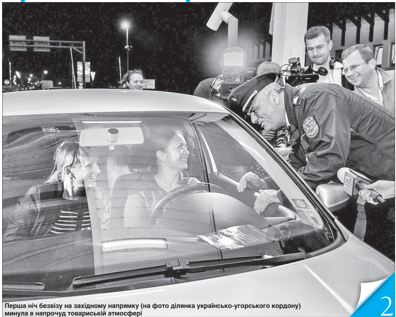
Перша ніч безвізу на західному напрямку (на фото ділянка українсько-угорського кордону) минула в напрочуд товариській атмосфері

«Відтепер слова «back in the USSR» ми будемо чути, лише слухаючи Beatles»