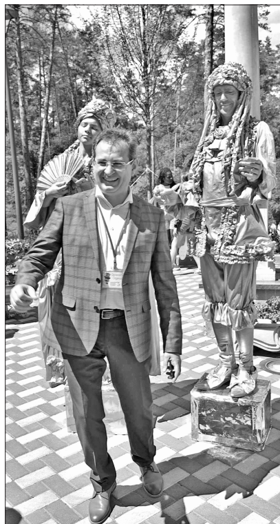
Народний артист України Богдан Струтинський опанує професію «живої скульптури»

Як же добре, що парк зберегли, а не забудували, як часто буває. Бо саме зелене шатро, кущі, тріщинуваті стовбури, шапки листя створюють чудову акустику, гасячи луни й поглинаючи фальш й нещирість.