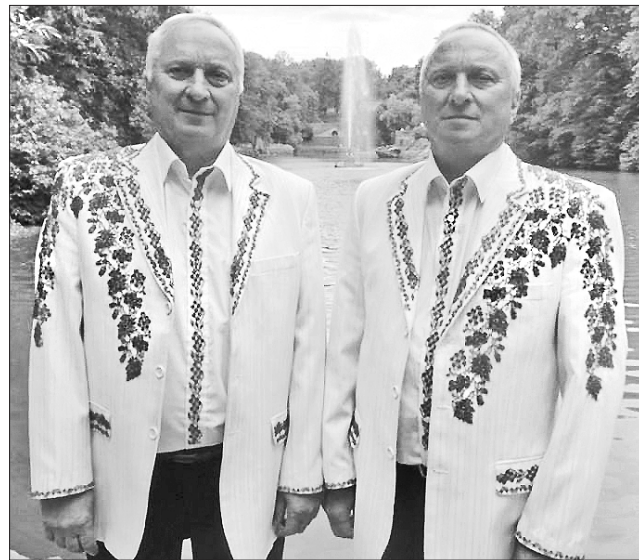
Пісня на багато років стала хітом і дала назву співочому дуету