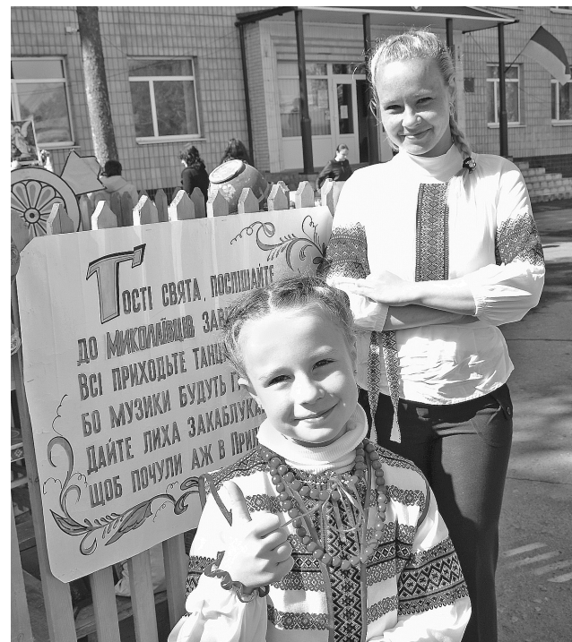
Коли світлина на згадку суцільний позитив

З-поміж приємних новин — нещодавнє відкриття у селищі аптеки, закупівля машин і обладнання для місцевого комунального підприємства, підготовка до сезону переробки цукрових буряків — після кількарічної перерви запрацює Віринський цукровий завод (до слова, цього року на Сумщині солодкі корені займають майже 6 тисяч гектарів), інші позитивні зміни. Місцева громада відчуває ділову активну підтримку агрофірми «Вікторія», яка фінансує соціальні проекти. Один з них — молодіжно-спортивний: недавно в селищі споруджено сучасний стадіон європейського зразка, на якому проводиться футбольні матчі миколаївська команда «Вікторія».