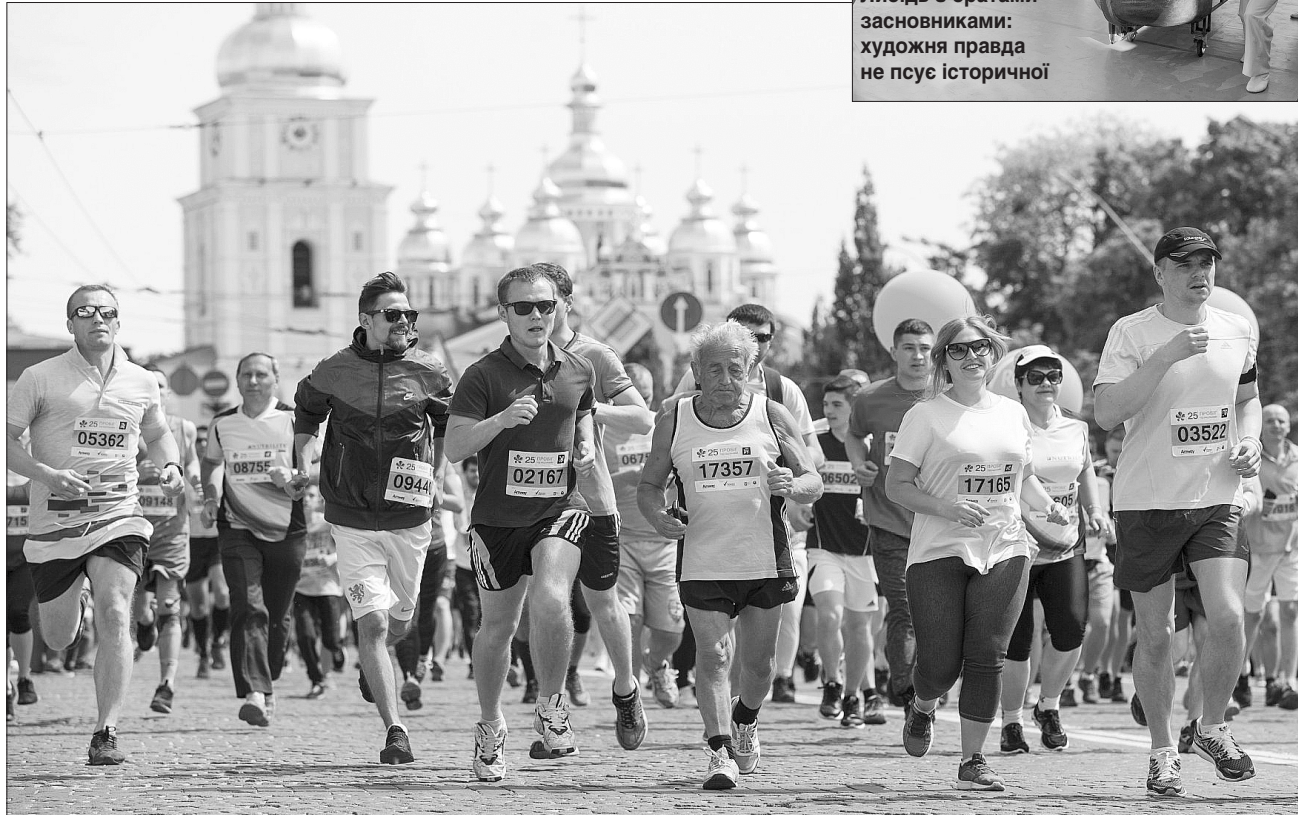
Либідь з братами-засновниками: художня правда не псує історичної

Столиця довела: на день міста добрі справи подвоюються