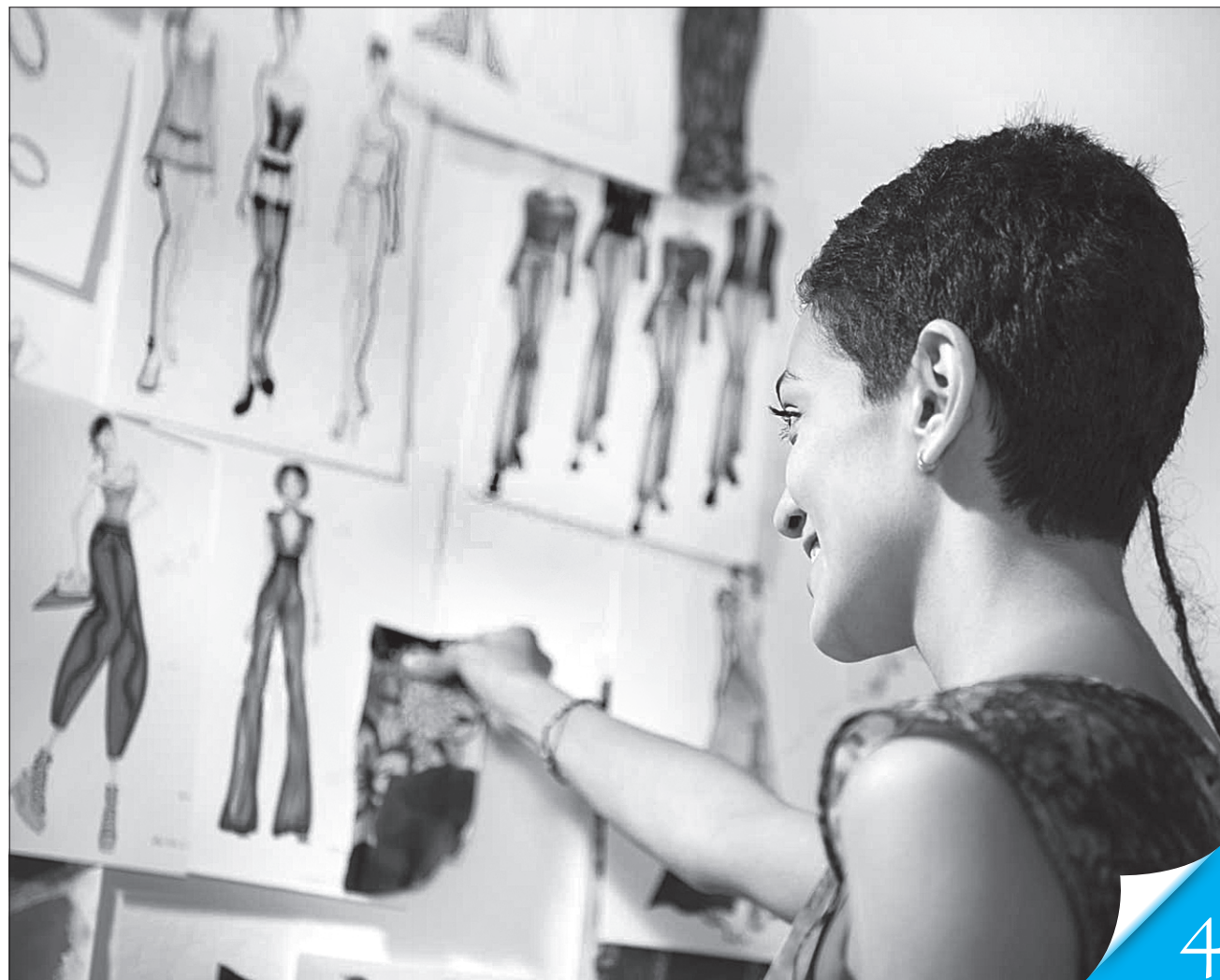
Щоб отримати роботу, економісти, юристи й педагоги обирають дизайн, психологію й туризм