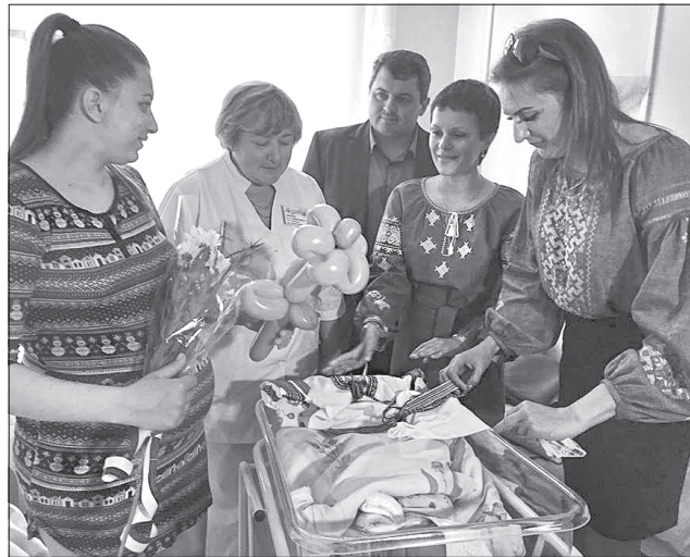
Вишиванка для немовляти стане оберегом

«Вражений, що, попри воєнні події, розвиток культури у вашій області — одне з найважливіших питань», — розповів про перші враження від цієї масштабної у культурному житті краю події заступник міністра культури Юрій Рибачук. Високий рівень організації