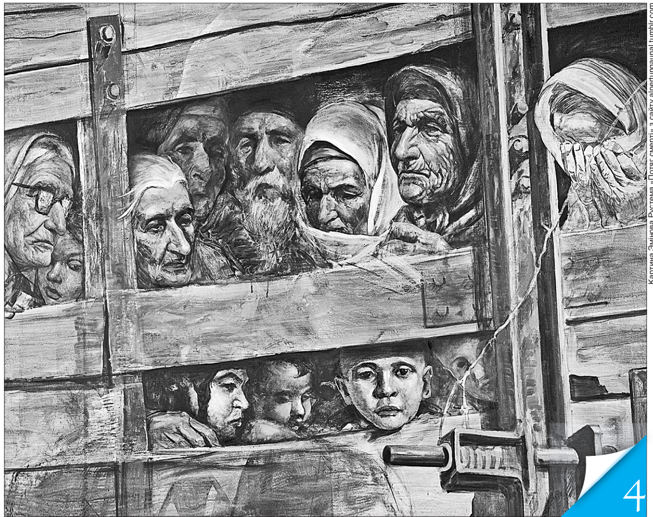
Картина Елінора Рустема «Політ смерті» з сайту albertunguinal.tumblr.com

ДАТА. Через 73 роки після примусової депортації кримські татари змушені обстоювати своє право вільно жити на рідній землі