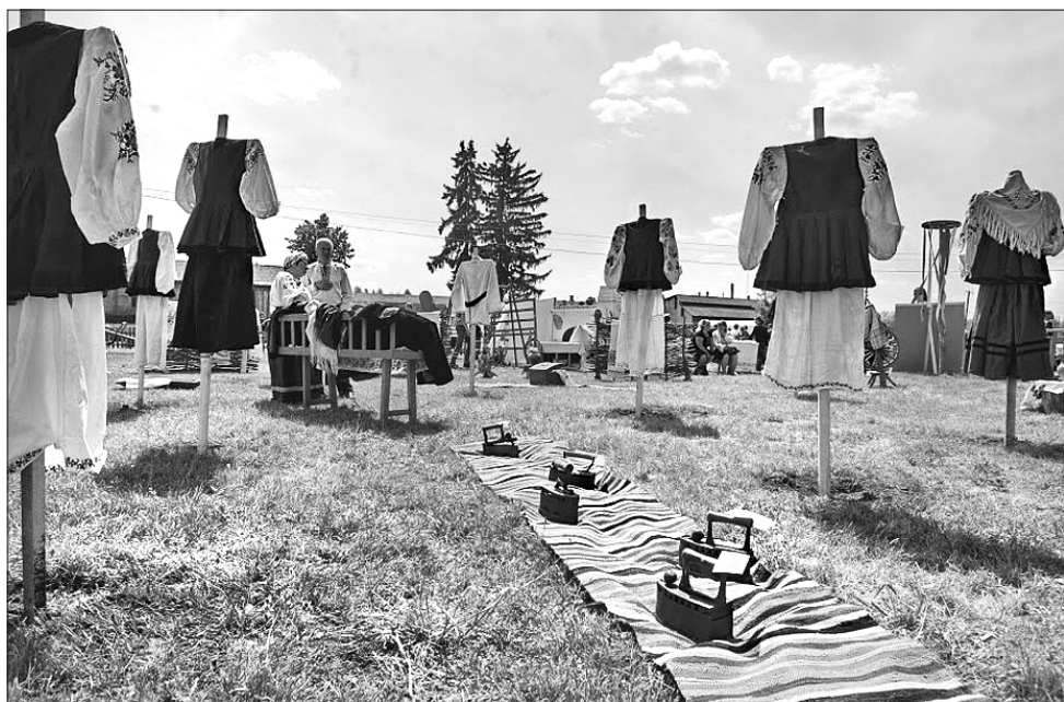
Просто неба: вишукано і з повагою

КОНКУРС. Результати двадцятого конкурсу учнівської молоді «Проба пера», в якому переможцями стали 56 юних поетів та прозаїків, підбили днями. Організований два десятиліття тому за ініціатииви обласного центру позашкільної освіти та роботи з творчою молоддю, конкурс став чудовою можливістю для школярів спробувати свої сили в красному письменстві. За цей час у ньому взяли участь понад 5 тисяч учнів Сумщини, які запропонували журі свої вірші, оповідання, казки, гуморески, п'єси тощо, видано кілька колективних збірників. Партнером освітан стала Сумська обласна організація Національної спілки письменників України — професійні автори постійно входять до складу конкурсного журі, визначаючи особливо талановитих та обдарованих авторів. І хай далеко не всі в дорослому житті матимуть справу з літературною творчістю, все-таки кожен учень відчув радість художнього натхнення.