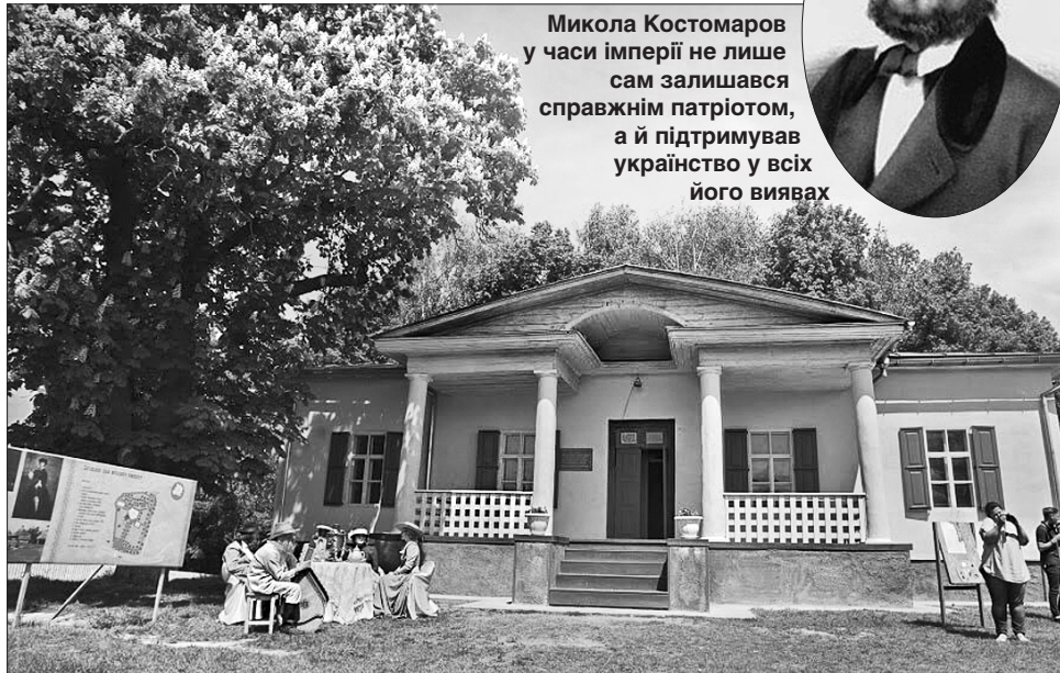
Нині важко повірити, що до 2008 року садиба була занедбаною...

Гості свята мали змогу оглянути будинок і дізнатися цікаві факти з життя фольклориста. А просто неба «З бабусиної скрині» експонували старі речі й предмети, збережені жителями району. Поряд розгорнули «Вулицю