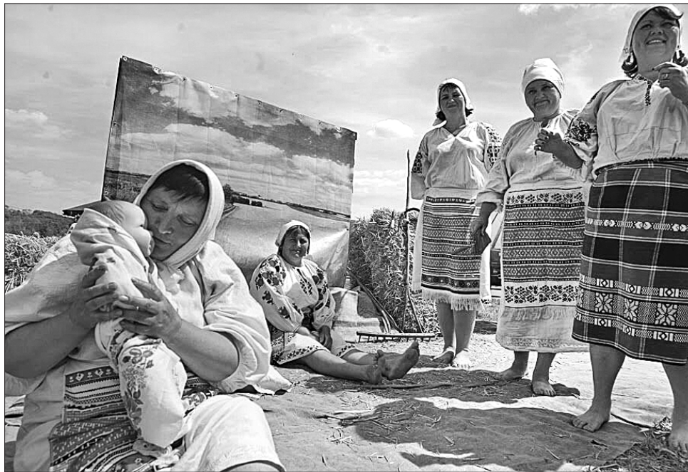
Микола Іванович добре знав, на що здатна справжня українська жінка

ремесел», а територіальні громади у своїх «курнях» пригощали місцевими смаколиками.