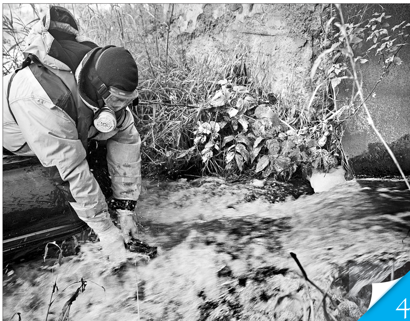
Так контролюють рідкі відходи за кордоном. В Україні системи моніторингу хвостосховищ відсутні, принаймні в сучасному розумінні слова «моніторинг»