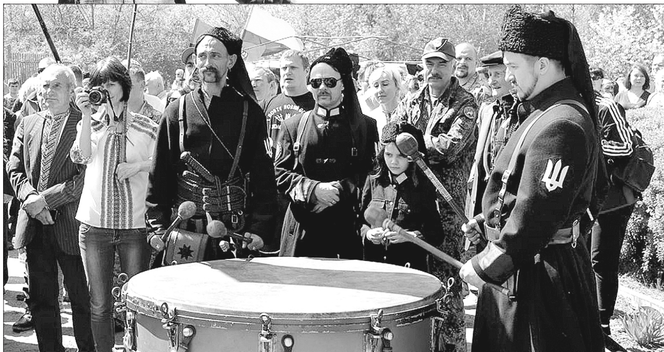
Чергове паломництво до Холодного Яру — з нагоди 100-річчя Української революції та століття Вільного козацтва