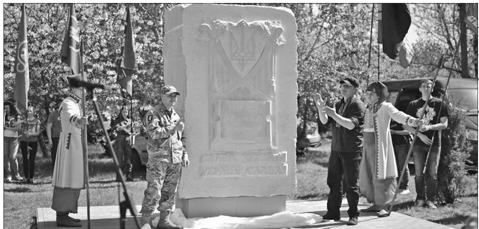
У 1919—1921 роках гасло українських патріотів звучало саме так, як викарбувано на пам'ятному знакові: «Слава Україні! — Україні Слава!»

Тепер подоланам не соромно запрошувати до себе гостей, зокрема і на вже традиційний етнофестиваль «Подільська підкова».