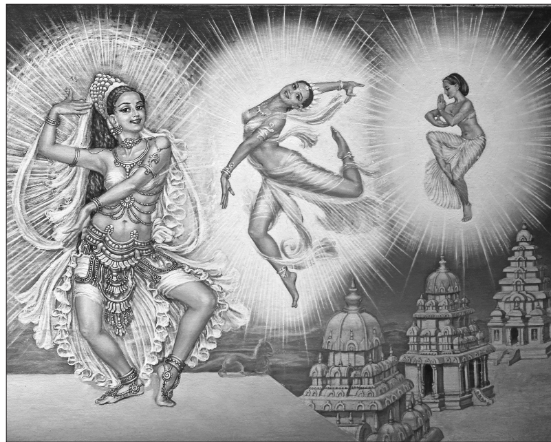
«У танці в старовинному стилі»