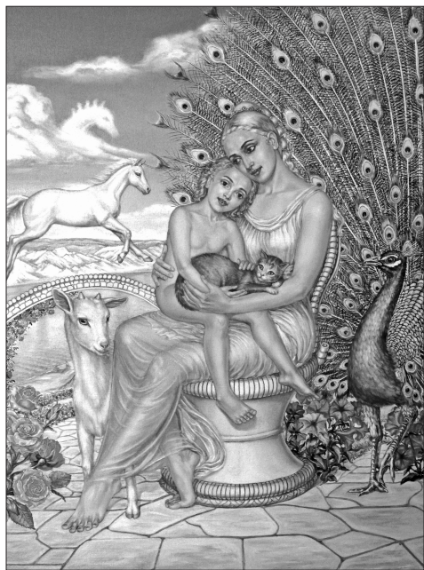
Е. Абакарова-Нісчал. «Материнство»;

Лікар надає послуги, пацієнт їх отримує, держава за це платить.