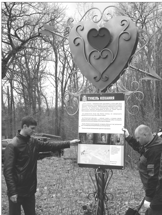
Толока біля тунелю завершилася «сердешно»

Отож за 700 тисяч тут облаштують дитячий ігровий комплекс, місця для відпочинку з барбекю-зоною, торговель-